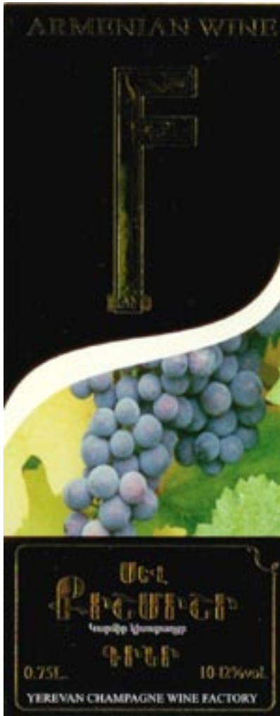
(526) Բացի “YEREVAN CHAMPAGNE WINE FACTORY” եւ “FRANS” անվանումներից

(210) 20081009 (111) 14116 (220) 26.09.2008 (151) 11.05.2009 (181) 26.09.2018 (730) “Երեւանի շամպայն գինիների գործարան” ԲԲԸ, Երեւան, Թբիլիսյան խճուղի 20, AM (540)