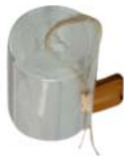
տարբերակ 1, պատկեր 2