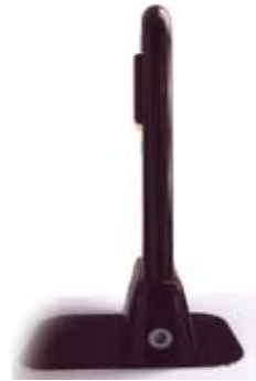
տարբերակ 1, պատկեր 2