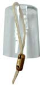
Տարբերակ 1, պատկեր 1