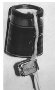
տարբերակ 2, պատկեր 3