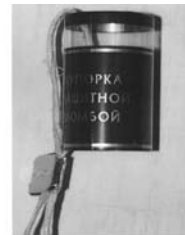
տարբերակ 2, պատկեր 2