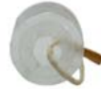
տարբերակ 1, պատկեր 5

(51) 09-07 (11) 235 (13) S (21) 20100005 (22) 05.03.2010 (31) 2009502816 (32) 13.10.2009 (33) RU (71) Փրայորիթի Քլաբ Ինք. (VG) (72) Ստրելցց Անդրեյ Վասիլիի (RU) (73) Փրայորիթի Քլաբ Ինք. (VG) (74) Հ. Դավթյան (54) Շշի խցանման միջոց (2 տարբերակ) (55)