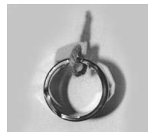
տարբերակ 2, պատկեր 4