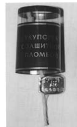
տարբերակ 2, պատկեր 1