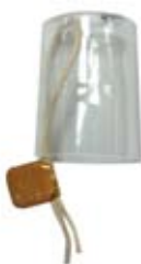
տարբերակ 1, պատկեր 4