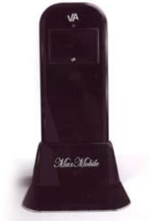
Տարբերակ 1, պատկեր 1