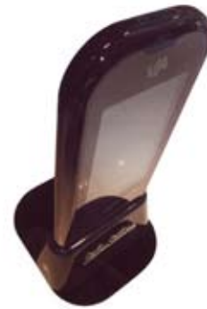
տարբերակ 1, պատկեր 3