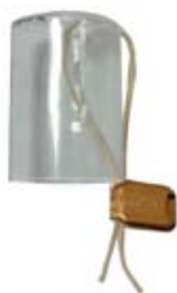
տարբերակ 1, պատկեր 3