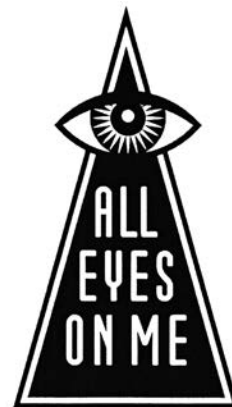
BAR // KITCHEN // HOOKAH